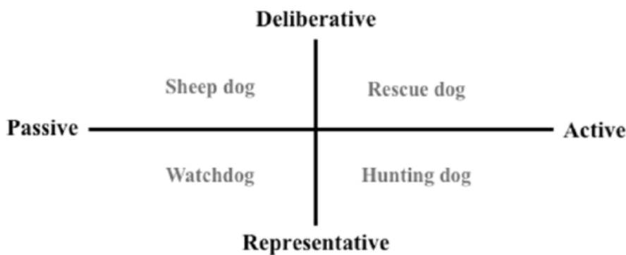
Figure 1. The journalistic compass

SoJo is theoretically most often considered from the normative perspective of the so-called journalistic compass founded by Peter Bro or the theory of framing by Robert Entman. “Solutions journalism is one example of the type of journalism where the reporter takes a more active role” (McIntyre, 2019, p. 20). Two sets of journalistic principles are presented in the compass (Figure 1). The first refers to the purpose of the journalistic profession, and according to this principle, journalists can take a passive role that involves reporting on existing problems, or an active role that involves monitoring the resolution of problems. In the second set of principles, we distinguish between the deliberative and representational models. In the representative, journalists focus on reporting on public and influential figures, representatives of authorities, organizations. In the deliberative model, journalists are focused on reporting on citizens. SoJo is an active problem reporting service with argumentative examples of functional solutions offered, focused on both citizens and decision-makers. Youth reporting can also be positioned in one of the above ways – passive or active, focusing on official sources (representative) or on (young) citizens (deliberative).